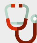
Ampla rede credenciada e especialidades