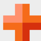
Planos de Saúde e Odontológico