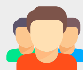
Qualidade de vida para sua família