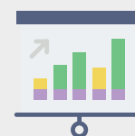
Referência na região

Cuidar da saúde da família é, sem dúvida, uma das formas de contribuir para que o associado tenha segurança e possa dedicar-se aos negócios com mais tranquilidade.